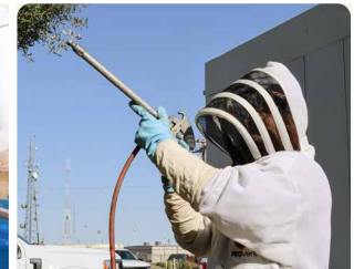
Técnico en control de vectores