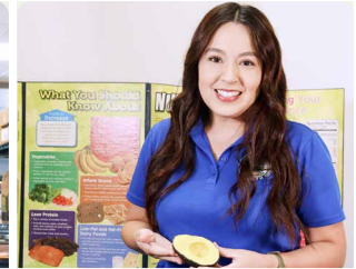
Educador en Salud

Con muchas categorías de trabajo en el departamento de salud pública, hay muchas maneras en que puedes utilizar tus conocimientos y habilidades para desarrollar una carrera en salud pública. Visita www.cdc.gov/stem para explorar más caminos profesionales en salud pública.